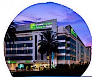
فندق هوليدي اكسبريس